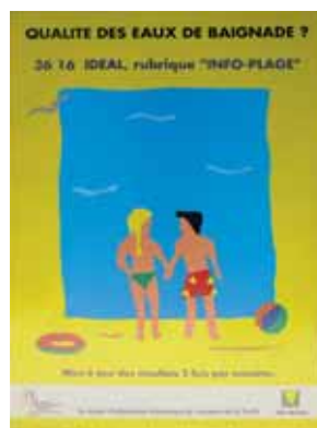
Information sur le minitel - Ministère de la solidarité, de la santé et de la protection sociale et Idéal télématique - 1990.