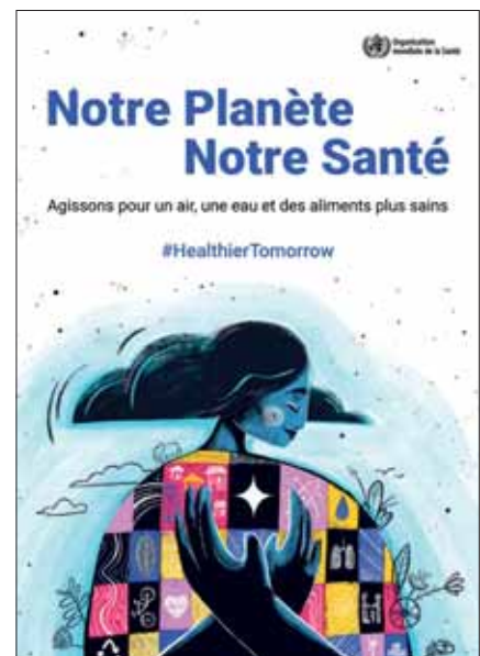
Affiche éditée à l'occasion de la journée mondiale de la santé - OMS - 2022.