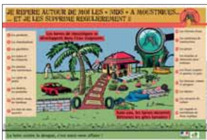
Affiche d'Anne-Cécile BOUTARD pour une campagne de lutte contre la dengue - Direction de la santé et du développement sociale de la Guyane et Conseil général de la Guyane - 2006.

En situation de crise, ses modalités de mise en œuvre sont adaptées à l'urgence de la situation.