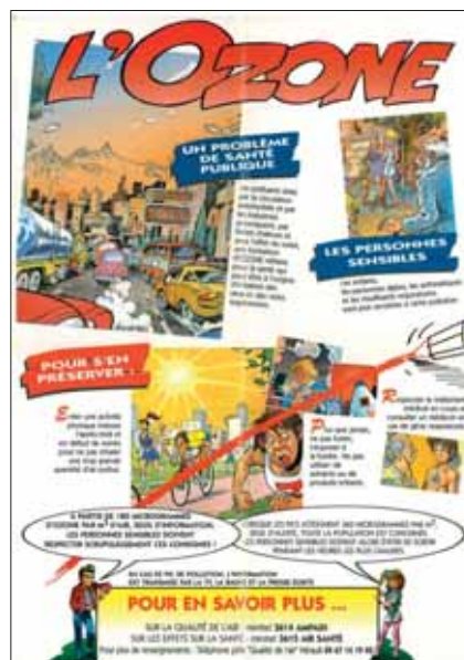
Affiche de Mohamed AOUAMRI décrivant les consignes à suivre en cas de pics d'ozone - Ministère de la santé et DDASS de la Seine-Maritime - 1997.