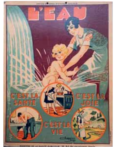
L'eau : affiche de Jean CHAPERON – Office national d'hygiène publique - Ministère de la santé publique - Editée entre 1924 et 1930.

Dans la seconde moitié du XIX e siècle, se sont développées les connaissances scientifiques et techniques conduisant au mouvement hygiéniste. Le Comité consultatif d'hygiène publique de France 1 est créé en 1848, mais 16 ans de discussions seront nécessaires pour arriver à la publication de la loi du 15 février 1902, relative à la protection de la santé publique. Elle porte sur les milieux de vie, la santé, la gestion des épidémies, la surveillance épidémiologique et l'organisation administrative. Elle prévoit une inspection départementale d'hygiène. Les maires sont tenus de prendre des règlements sanitaires pour prévenir l'extension des maladies infectieuses. Au départ, ces règlements concernent surtout l'habitat et la protection des eaux d'alimentation ; les problèmes sanitaires traités s'élargiront au cours du temps (assainissement, déchets, alimentation, maladies contagieuses...). Les dépenses rendues nécessaires par la loi sont obligatoires et réparties entre les communes, les départements et l'Etat.