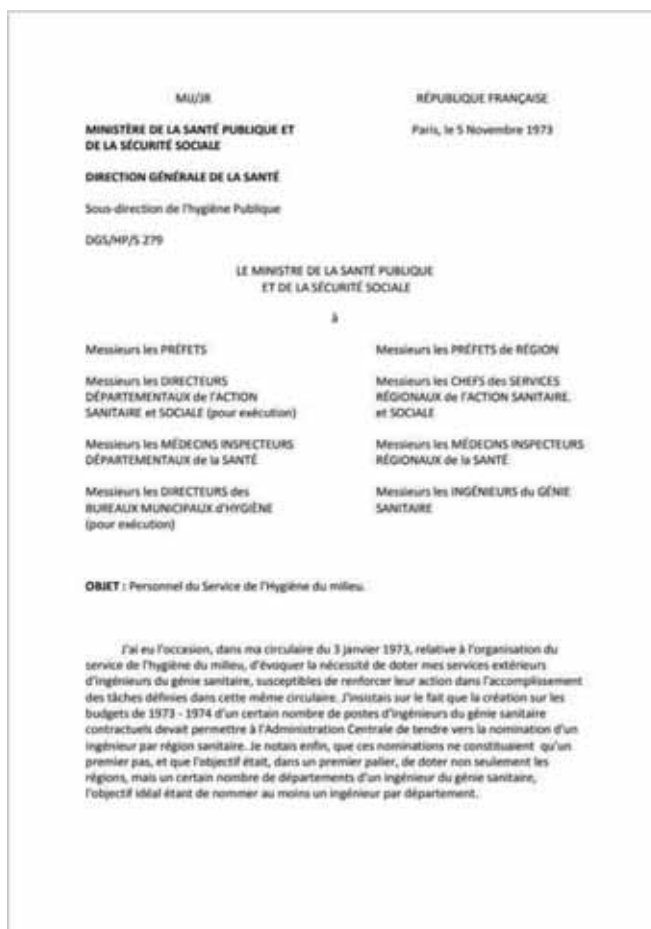
Extraits (1 ère page) des deux circulaires de 1973.