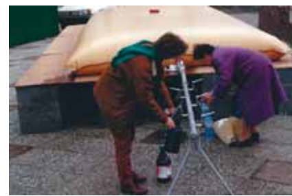
Dispositif d'alimentation en eau de secours mis en place à l'occasion de la contamination du réseau d'eau potable de la ville d'Yvetot en Seine-Maritime - DDASS de Seine-Maritime - 1995.